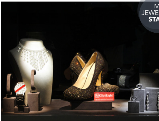
MK JEWELLERY STAGE

LICHT & LADENBAU: MüllerKälber plant, entwickelt und baut Läden, Shop-in-Shop-Systeme, Vitrinen und Beleuchtungsmodule. Dabei kann das Unternehmen auf über 40 Jahre Erfahrung zurückblicken.