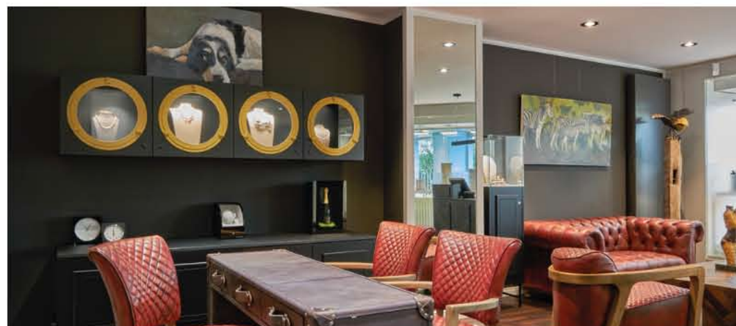
Horz Speyer - Vitrinenmodule mit MK OptiLight

MüllerKälber steht für ganzheitliche Präsentationssysteme, in denen Raum, Vitrine und Licht präzise aufeinander abgestimmt sind. So entstehen Lösungen, die Schmuck und Uhren in ihrer Wertigkeit erfahrbar machen und Orientierung im Verkaufsraum schaffen.