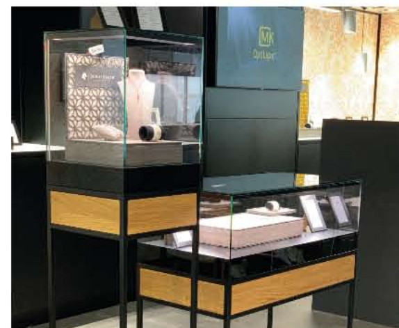
MK OptiLight 3.0 - Sockel- und Tischaufsatz